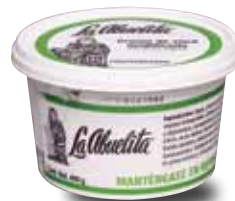
LA ABUELITA Crema de vaca acidificada con grasa vegetal pasteurizada, 400 g