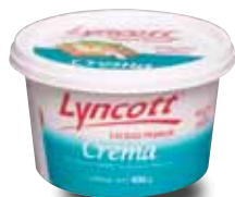
LYNCOTT Crema acidificada elaborada con leche pasteurizada de vaca reducida en grasa, 400 g