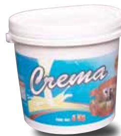
LAS PALMAS Crema, 4 kg

Información comercial: por contener grasa vegetal no debe ostentarse como "crema" si no "crema con grasa vegetal. No cumple con el contenido de proteína declarado. Ostenta la imagen de una vaca pero contiene grasa vegetal.