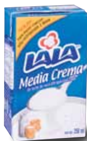
LALA Media crema de leche de vaca ultrapasteurizada, 250 ml