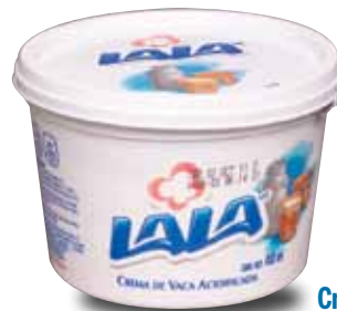
LALA Crema de vaca acidificada, 200 ml y 450 ml