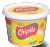
CHIPILO Crema acidificada, 450 g