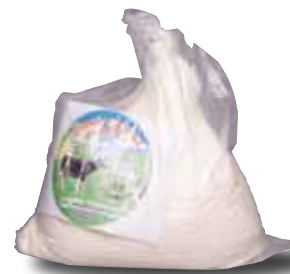
EL SAUCE Crema especial, a granel