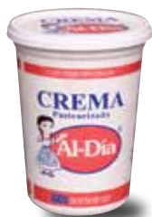
AL-DÍA Crema pasteurizada, 900 g y 450 g