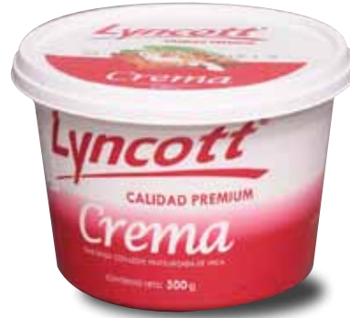
LYNCOTT Crema elaborada con leche pasteurizada de vaca, 500 g