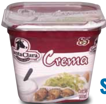
SANTA CLARA Crema, 900 ml