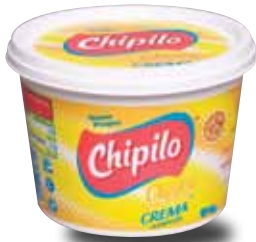
CHIPILO Crema acidificada, 450 g

Información comercial: por contener grasa vegetal no debe ostentarse como "crema" si no "crema con grasa vegetal". En tanto que por su contenido de grasa debería denominarse "media crema".