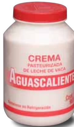
AGUASCALIENTES Crema pasteurizada de leche de vaca, 960 g