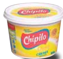
CHIPILO Crema acidificada, 450 g