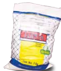
LUPITA Media crema vegetal y de leche pasteurizada, 1 Kg