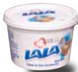
LALA Crema de vaca acidificada, 200 ml y 450 ml