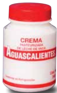
AGUASCALIENTES Crema pasteurizada de leche de vaca, 240 g