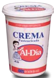
AL-DÍA Crema pasteurizada, 900 g y 450 g