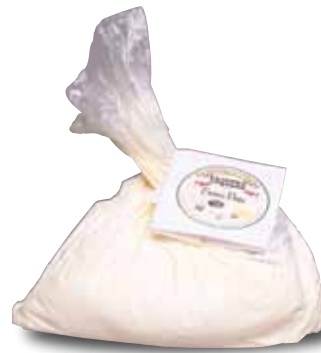
VAQUERO CREMA, A GRANEL

Información comercial: sus contenidos de grasa y proteína declarados difieren, por mucho, de los valores encontrados: declara 27 % máximo de grasa y 19% mínimo de proteína.