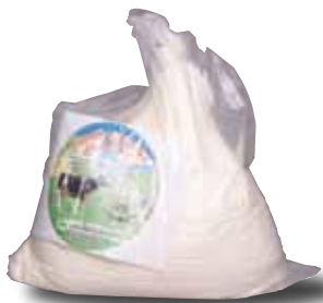
EL SAUCE Crema especial, a granel

Información comercial: no declara contenido de proteína. Se encontró una muestra hasta con 30.5% menos del contenido de grasa declarado. El contenido de grasa se presenta como un rango, debido a que los lotes analizados no son homogéneos.