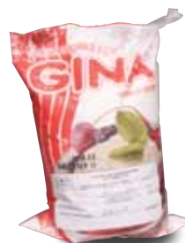
GINA Crema vegetal ligera, 1 Kg