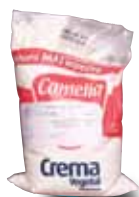
CAMELIA Crema vegetal, 1 Kg