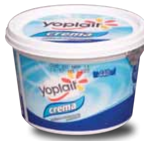
YOPLAIT Crema acidificada de leche de vaca pasteurizada, 200 ml y 440 ml