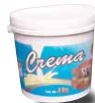
LAS PALMAS Crema, 4 Kg