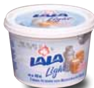
LALA Light Crema acidificada reducida en grasa 450 g