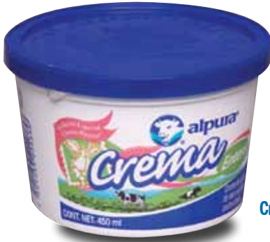
ALPURA Crema de leche de vaca acidificada pasteurizada, 200 y 450 ml