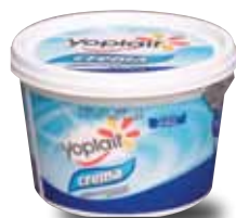
YOPLAIT Crema acidificada de leche de vaca pasteurizada, 200 ml y 440 ml